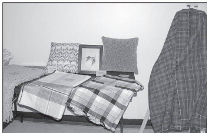
Aline Grenier, tissage