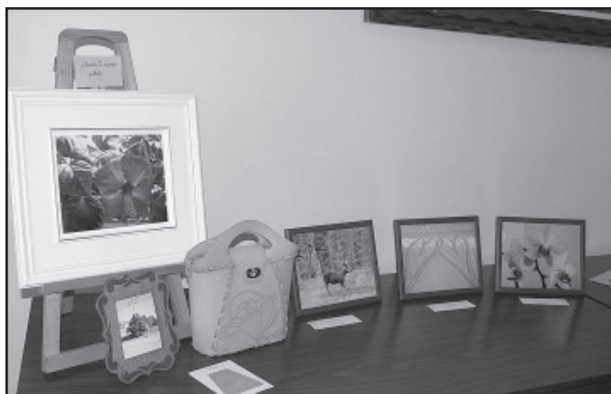
Réal Francoeur, photographie